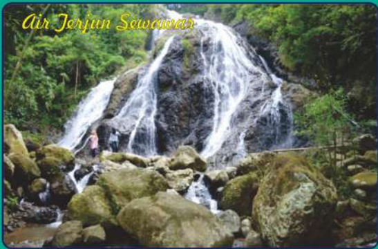
Air Terjun Sewawati

Indahnya air pegunungan yang mengalir memudar di tebing cadas Sewawati menjadi daya tarik bagi kawula muda yang suka tantangan alam. Lokasi air terjun ini berada di dusun Sekarang, Desa Trengguli Kecamatan Jenawi