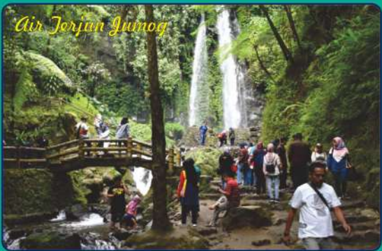
Air Terjun Jumog

Air terjun Jumog , dibuka untuk umum sejak tahun 2004, dilengkapi dengan kolam renang serta sarana wisata lainnya. Jernihnya air pegunungan yang turun dari ketinggian menjadi tempat wisata yang menarik untuk dikunjungi. Berada di desa Berjo, Kecamatan Ngargoyoso, Karanganyar.