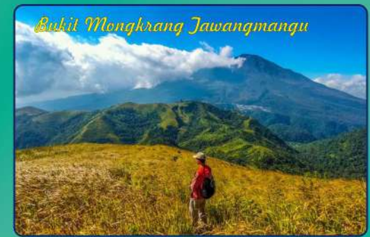
Bukit Mongkrang Jawangmangu

Objek wisata ini sudah mulai dikunjungi sejak pukul 04.30 pagi. Tujuan utamanya adalah menyaksikan indahnya matahari terbit. Objek wisata ini terletak di Sumbarsari, Desa Kemuning, Kecamatan Ngarogoyoso, Kabupaten Karanganyar.