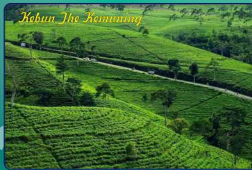
Kebun Teh Kemuning

Puncak Hargo Dumilah G. Lawu dapat dicapai melalui Kabupaten Karanganyar dengan 3 jalur yaitu Via Cemoro Kandang (Tawangmangu), Via Candi Cetho (Jenawi), Via Tambak (Ngarogoyoso).