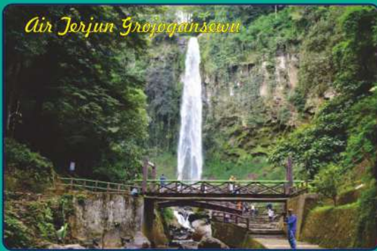
Air Terjun Grojogansewu

Air terjun yang sangat terkenal di Jawa Tengah adalah Grojogansewu (81meter), tetap menarik untuk dikunjungi wisatawan saat liburan yang selalu ingin dekat dengan alam pegunungan di Tawangmangu, Karanganyar