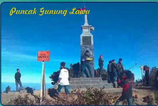
Puncak Gunung Lawu

Puncak Hargo Dumilah G. Lawu dapat dicapai melalui Kabupaten Karanganyar dengan 3 jalur yaitu Via Cemoro Kandang (Tawangmangu), Via Candi Cetho (Jenawi), Via Tambak (Ngarogoyoso).