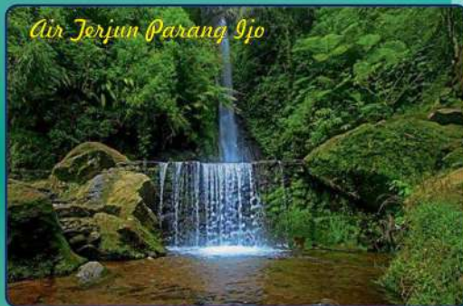
Air Terjun Parang Ijo

Bukit Mongkrang sangat digemari, mulai dari pemandangan alamnya yang indah dan juga jalur pendakian yang ringan dan jalurnya juga tidak rumit sehingga cocok bagi pemula.